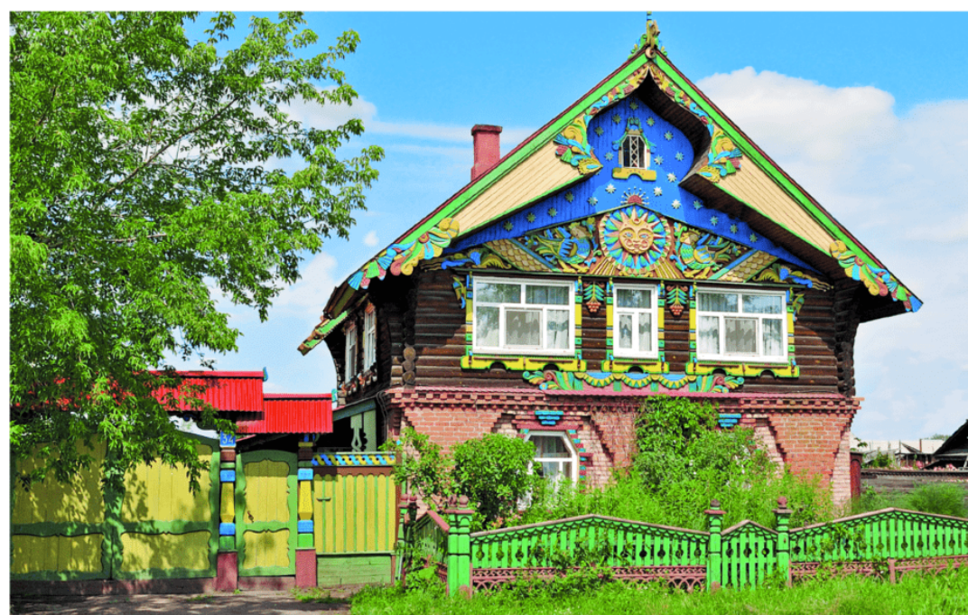
МАРИЙНСК 300 лет