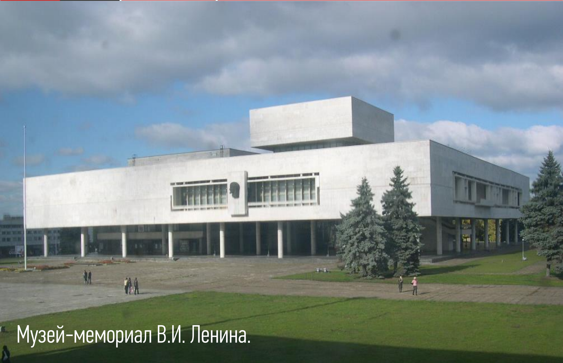
Музей-мемориал В.И. Ленина.