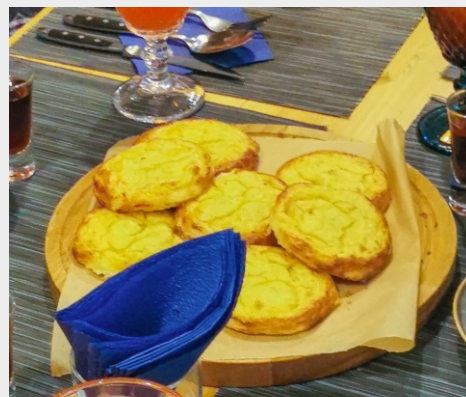
шаньги на тонком тесте