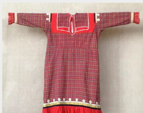
РУБАШКА из ткани «пестрядь»