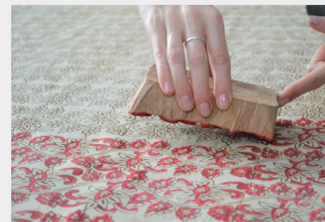
НАБОЙКА И МАНЕРЫ способ украшения ткани