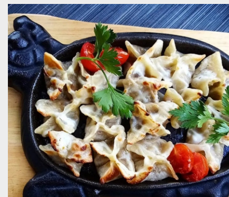
кундюмы с грибами