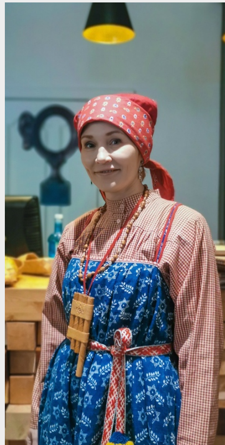
ДУБАС ответ русскому сарафану