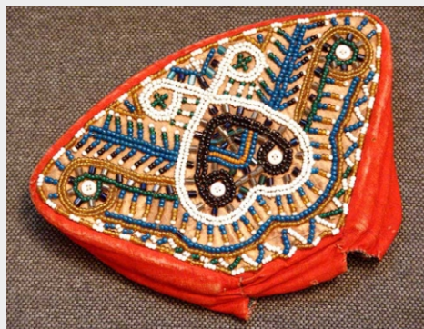
ШАМШУРА нарядный головной убор