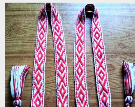
ПОЯС С ОРНАМЕНТОМ важная часть костюма